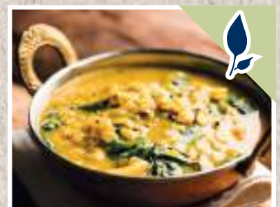
GELBES THAI CURRY