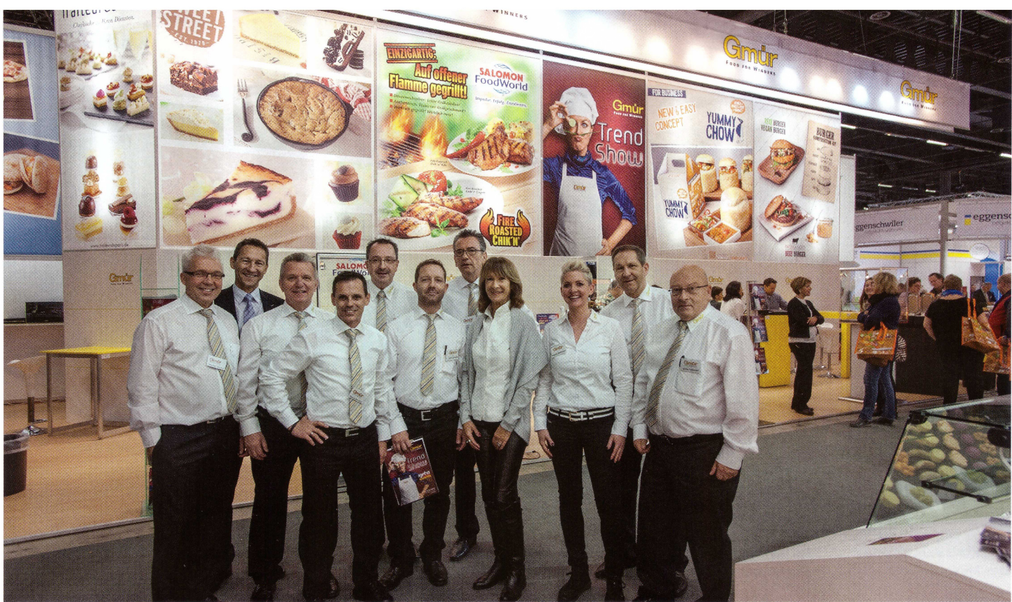
Das kompetente Team der Gmür AG an der Igeho 2015.